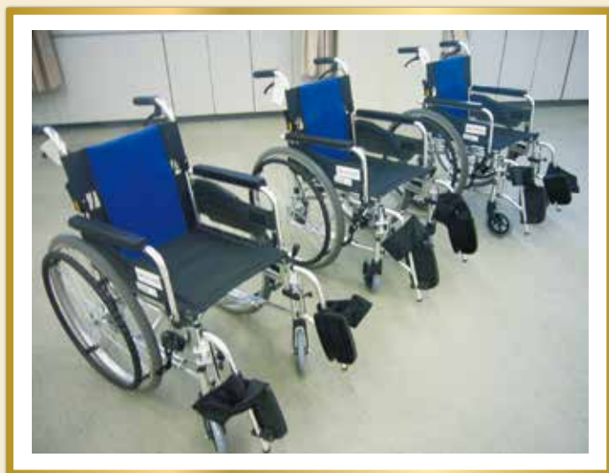
寄付された車いす

このたび、株式会社中京銀行様より、愛知県社会福祉協議会を通じて、車いす3台を寄贈いただきました。本会では、車いすの貸し出しを実施しておりますが、劣化が一部の機種で進んでいたため、今回のお話は大変ありがたいものでした。車いすは、区民のみなさまへの貸し出しのほか、区内学校においての福祉教育の授業等において、活用していく予定です。ありがとうございました。