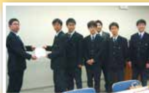
名古屋工学院専門学校 高等課程生徒会様

熱田区社会福祉協議会では、地域福祉活動を充実させるためのご寄付を受け付けています。みなさまのご協力をお待ちしております。