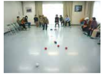
いつの間にか夢中になる 「ボッチャ」