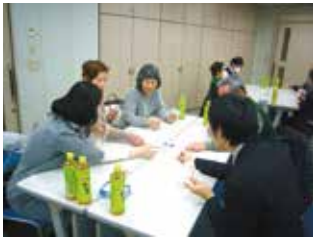
みんなで盛り上がる 「カードゲーム」

熱田区社会福祉協議会では、サロン等地域交流の場の運営支援として「レクリエーション用品の貸し出し」を実施しています。ルールが簡単で大人も子どもも楽しめるものばかりを集めました。ぜひご利用ください!