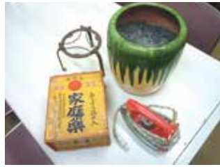
思い出の品を楽しみながら語り合おう 「回想法セット」