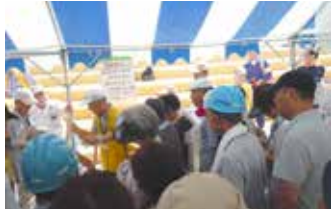
総合防災訓練への参加

あつた災害ボランティアネットワークでは、現在16名のメンバーで活動しておりますが、新たなメンバーを募集中です。熱田区での災害・防災活動に興味のある方ならどなたでも参加できます。みなさんで力を合わせて、「災害に強いまち熱田」を目指しましょう。