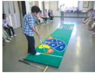
誰とでも気軽に楽しめる 「ゲーゴルセット」