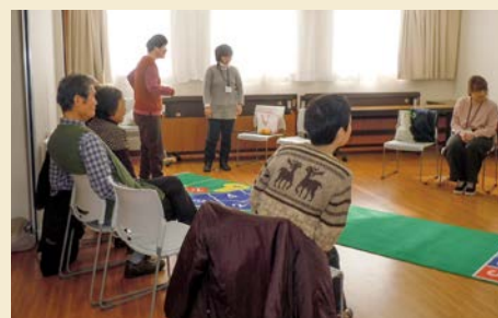
かよういちサロン

お問い合わせ先 熱田区社会福祉協議会 電話:671-2875 FAX:671-4019