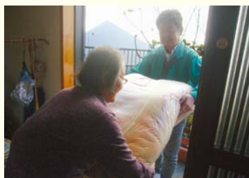
寝具クリーニングサービス事業