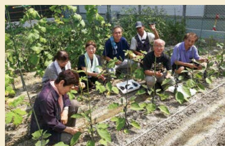
友愛サロン 健康の泉

今年度から、サロンへの運営助成金制度が一部変わりました。サロンのことは「サロン何でも相談所」である区社協にご相談ください。