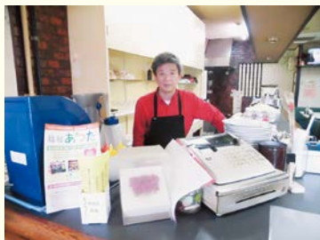
ふくし協力店(Aグループ)