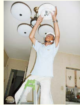
地域支えあい事業