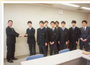
◀名古屋工学院専門学校 高等課程生徒会様

熱田区社会福祉協議会 では、地域福祉活動を 充実させるためのご寄 付を受け付けていま す。皆さまのご協力を お待ちしております。