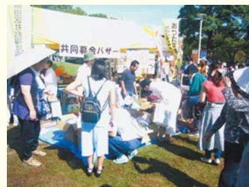
共同募金バザー(区民まつり)