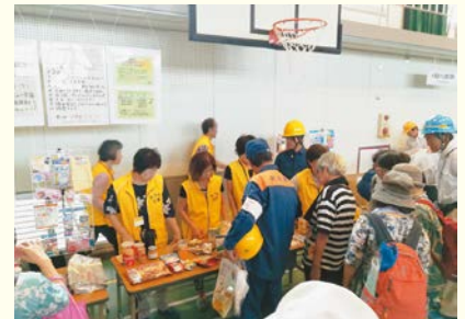
あつた災害ボランティアネットワーク防災訓練にて