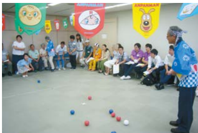
ボッチャで交流「出張ボッチャも行っていますよ!」

ボランティアとして参加された(株)中北薬品さん、薬のサンハート(株)さんには協賛品のご提供をいただき、ありがとうございました。