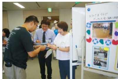
名刺交換「今後もよろしくおねがいします」