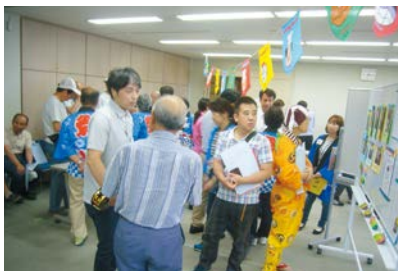
「ボランティアさん、ぜひうちの施設に来てください!」