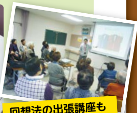
回想法の出張講座も実施しています。