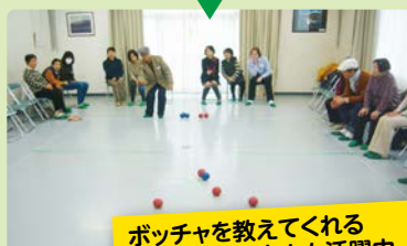
ポッチャを教えてくれるボランティアさんも活躍中。