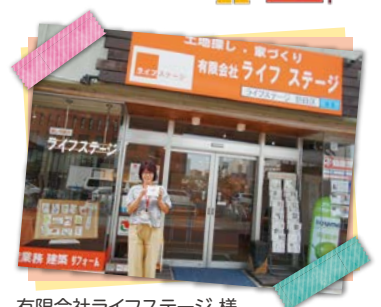
有限会社ライフステージ 様