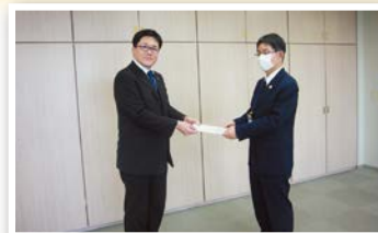
▲名古屋工学院専門学校高等課程生徒会様

熱田区社会福祉協議会 では、地域福祉活動を充 実させるためのご寄付を 受け付けています。皆さ まのご協力をお待ちして おります。