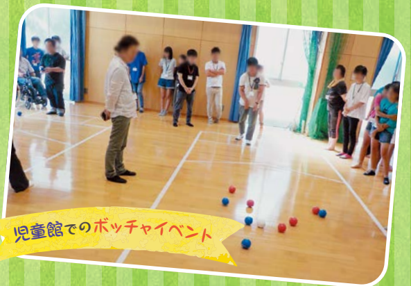
児童館でのポッチャイベント

令和元年度(2019)～令和5年度(2023)までの5年間を実施期間として、昨年度から取り組みが始められました。昨年度は児童館でのポッチャイベントやひびの健やかフェスティバル等を実施すると共に、計画委員のみなさんと熱田区内で行われているイベント等の情報をそれぞれ出し合い共有しました。