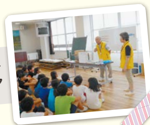
あつた災害 ボランティア