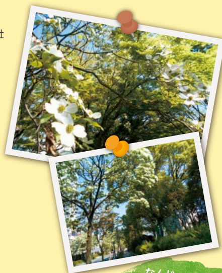
なんじゃ もんじゃ並木

株式会社新しとり斎場 アクティブインターナショナル株式会社 名古屋フィルター販売株式会社 株式会社中部プラントサービス 名古屋青果株式会社 名古屋品証研株式会社 株式会社シモデン 株式会社山田商会 株式会社ハラタ 有限会社原田 株式会社林エンジニアリング 東邦総合サービス株式会社 合資会社東谷籐品製作所 学校法人名古屋学院大学 名古屋トヨペット株式会社熱田店 中部機械刃物株式会社 株式会社東液供給センター 彫清昇龍株式会社