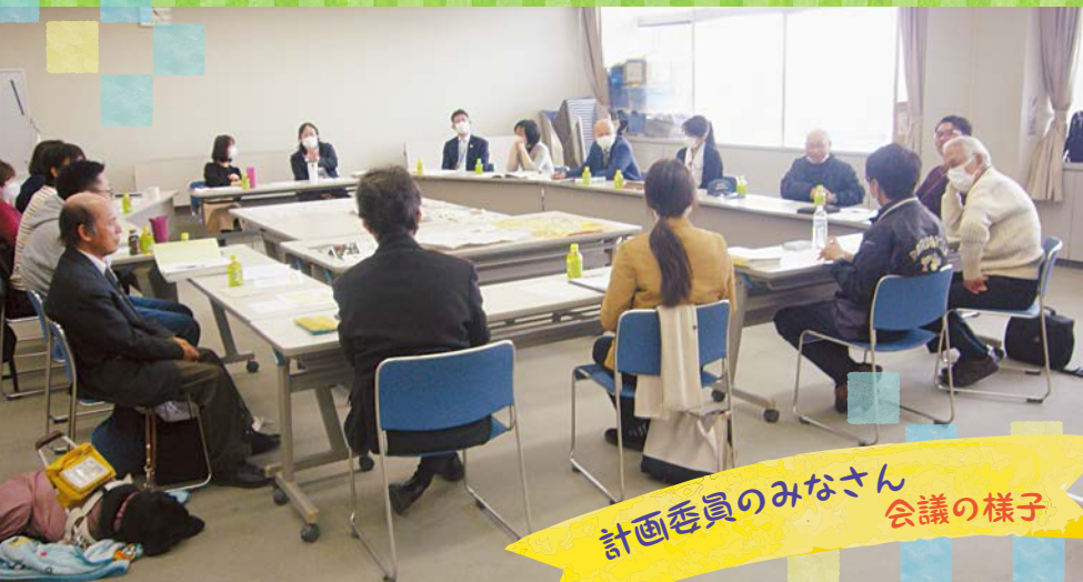
計画委員のみなさん 会議の様子

今年後は「熱田区史跡めぐりウォーキングマッププロジェクト」を予定しております。高齢者から児童までさまざまな方をモニターとして募集し、熱田区区内の史跡を巡りながら、より散策等を楽しむことができるような素敵なマップを作る予定です。また詳細が決まりましたらお知らせいたしますので楽しみにして下さい。(内容については変更になる場合があります。)