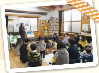
子育てサロン [mamaの笑顔]