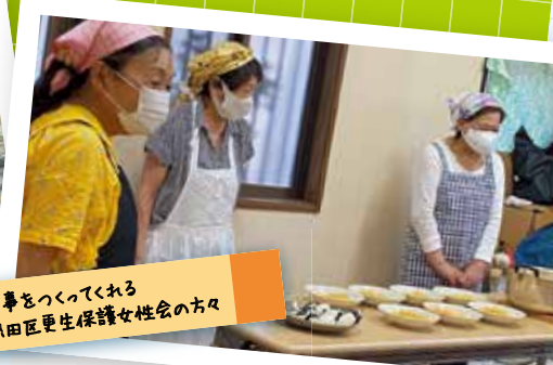
食事をつくられる 熱田区更生保護女性会の方々