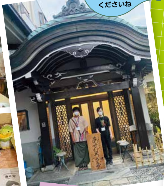
初めて参加する人は電話をくださいね