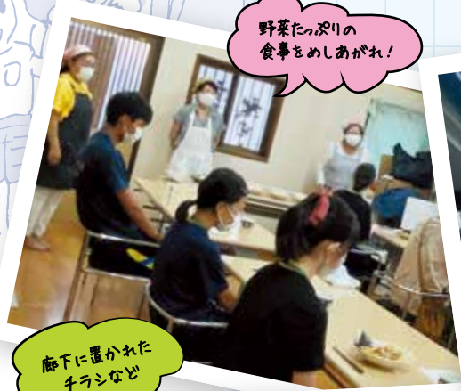
野菜たっぷりの食事をめしあがれ!