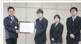
名古屋工学院専門学校高等課程生徒会 様

熱田区社会福祉協議会では、 地域福祉活動を充実させる ためのご寄付を受け付けて います。皆さまのご協力を お待ちしております。