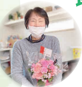
野立学区 相談窓口 スタート!!

地域支えあい事業とは、ちょっとした相談を受ける相談窓口が地域にあたり、相談を受けて地域の方と一緒にちょっとしたお手伝いを行う事業です。現在、名古屋市各地で100学区以上がこの事業を行っています。熱田区では、3月に野立学区がこの事業を開始し区内全区で事業を行うことになりました。各学区の皆様で、「ちょっと聞いてほしいな…」「こんなこと手伝ってもらえると助かるんだけど…」ということがありましたら、各学区の窓口、または熱田区社会福祉協議会へご相談ください。