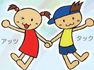
熱田区社会福祉協議会オリジナルキャラクター