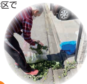
おたすけ活動 (庭木剪定)